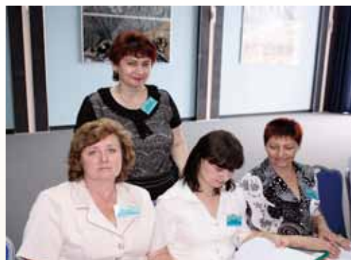
Практикующие психологи ММГЛ

ПРОГРАММА РЕАБИЛИТАЦИИ СОГЛАСОВАНА С РУКОВОДСТВОМ СЕВЕРО-КАВКАЗСКОГО ФЕДЕРАЛЬНОГО ОКРУГА И СТАВРОПОЛЬСКОГО КРАЯ. ВСЕГО С НАЧАЛА ВЫПОЛНЕНИЯ ПРОГРАММЫ МИРОТВОРЧЕСКОЙ МИССИЕЙ РЕАБИЛИТИРОВАНО 410 ЧЕЛОВЕК.