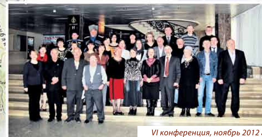
VI конференция, ноябрь 2012 г.