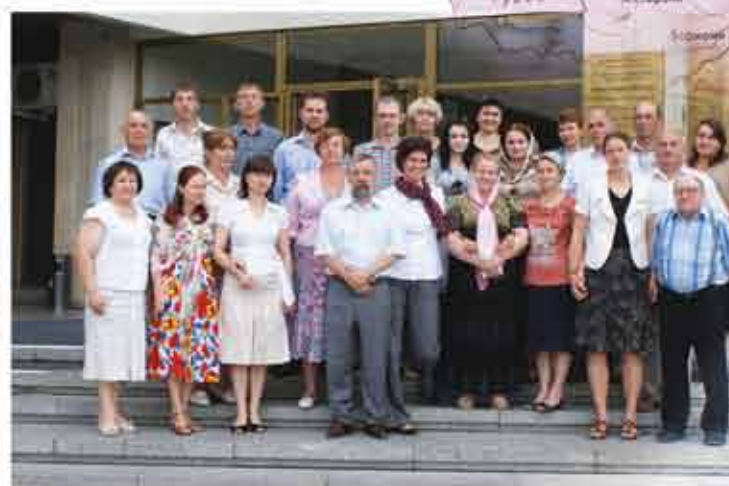
Рабочая встреча, июль 2011 г.