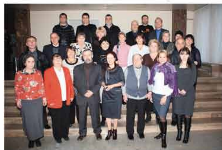
Заседание ММГЛ, декабрь 2010 г.