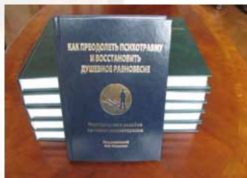
Методическое пособие для пострадавших

ПРОГРАММА РЕАБИЛИТАЦИИ СОГЛАСОВАНА С РУКОВОДСТВОМ СЕВЕРО-КАВКАЗСКОГО ФЕДЕРАЛЬНОГО ОКРУГА И СТАВРОПОЛЬСКОГО КРАЯ. ВСЕГО С НАЧАЛА ВЫПОЛНЕНИЯ ПРОГРАММЫ МИРОТВОРЧЕСКОЙ МИССИЕЙ РЕАБИЛИТИРОВАНО 410 ЧЕЛОВЕК.