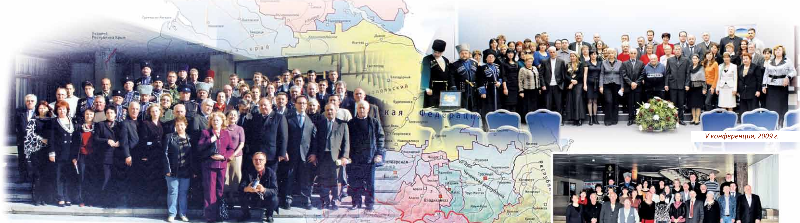
V конференция, 2009 г.